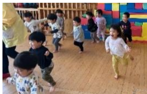
ぶつからないように前見て走ろうね！