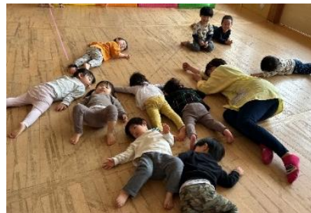
つかれたあ～！ゴロン