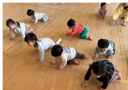
赤ちゃんのまねっこ。“ハイハイ”